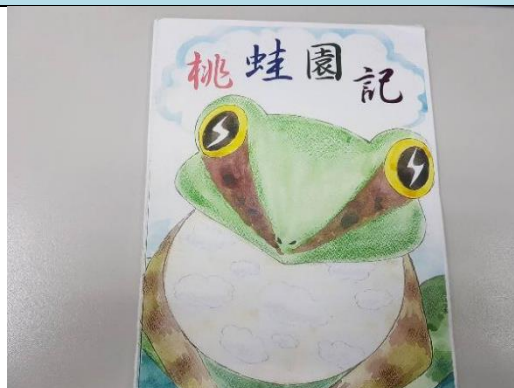
作品樣書 (彩印加上文字)