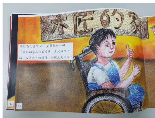
彩色影印樣書 (文字編排貼上含頁碼)