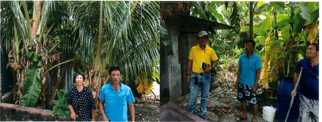
南八里 710 地號:現況有 2 位族人各自使用部份