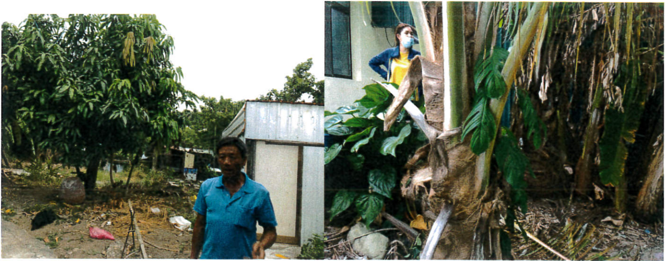
南八里 708 地號:現況有 2 位族人各自使用部份且部份為公共設施