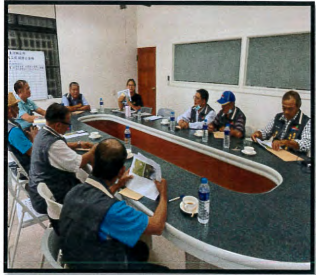
萬年段 1420、1418 地號 案地會勘