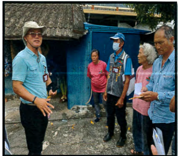
南河段 734、735、736 地號 案地會勘