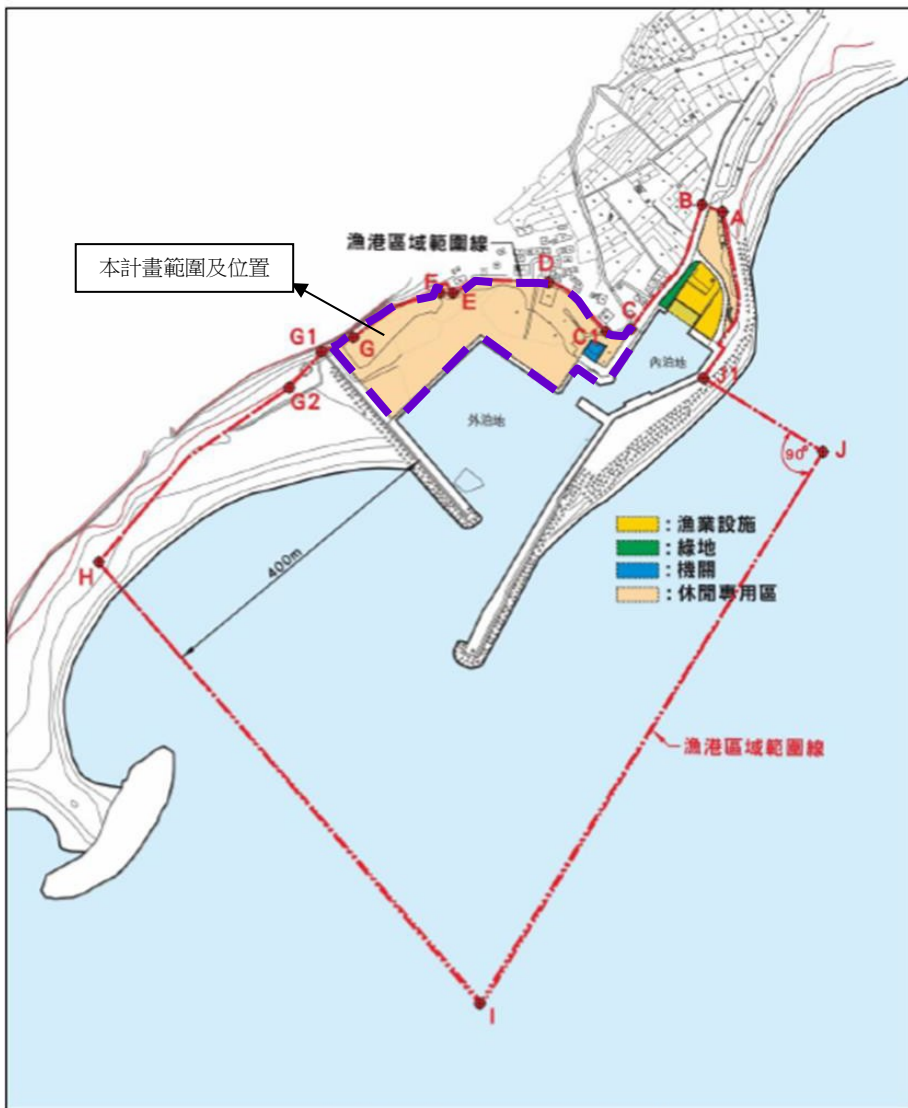
圖 1 金樽漁港區域平面圖

金樽漁港為一座位於臺灣臺東縣東河鄉東河村的一座漁港，該漁港距離臺東市區約 40 公里，距離北邊的成功鎮新港約 20 公里，擁有漁港、小海灣、離岸礁、綿長沙灘及海岸壁等諸多地景之風景區，因灣似酒杯，故取名為“金樽”，於民國 76 年啟用，主管機關為臺東縣政府，屬於第二類漁港，本計畫以金樽漁港西側休閒專用區東河鄉新大馬段 800 及 802 地號等 2 筆部分土地作為改善環境暨活化利用之基地。