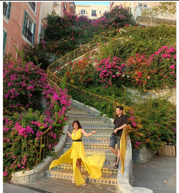
地中海日落小鎮—龍梯