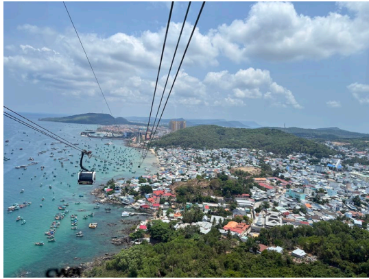
360 度全景跨海纜車(Sunworld Cable Car)