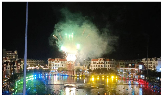
Charm of Venice Show 光雕秀