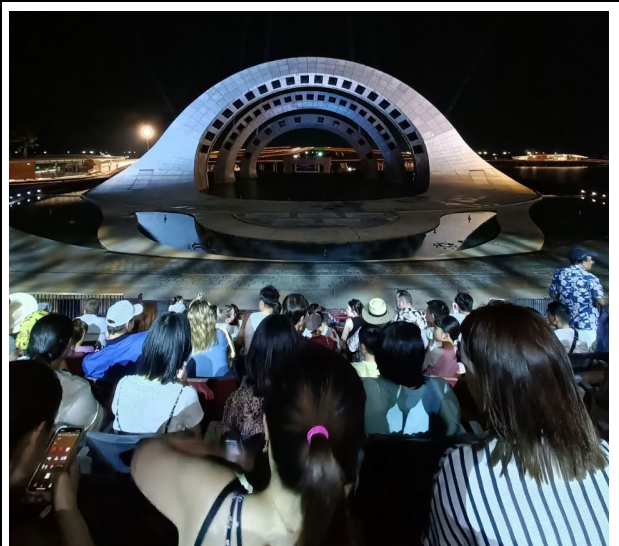
海洋之吻 (Kiss of the Sea)