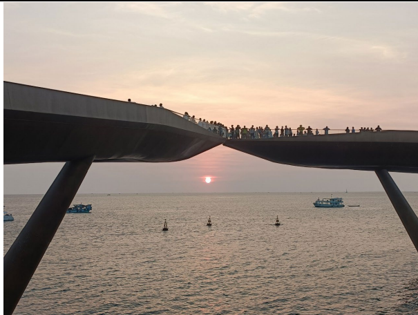
地中海日落小鎮—吻橋