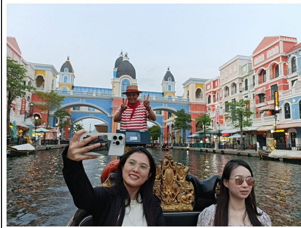
大世界不夜城(仿造威尼斯運河)