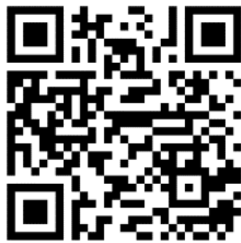
報名 QR Code