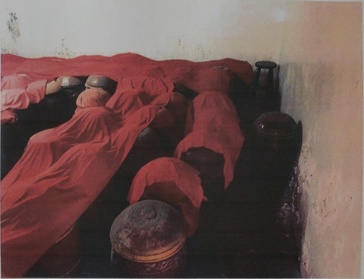
無主骨灰骸罐總計 50 餘個（別有大中小等不同尺）。