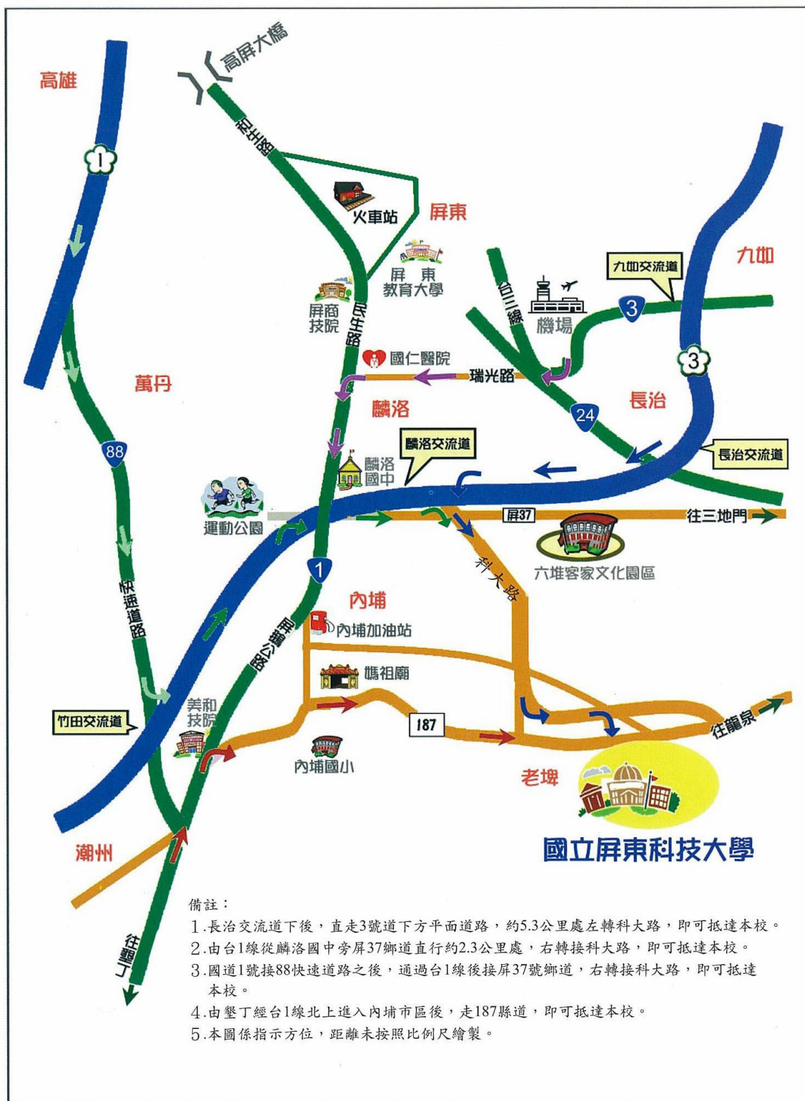
國立屏東科技大學位置示意圖