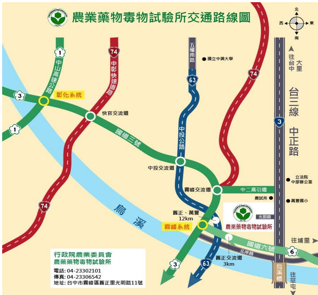
行政院農委會農業藥物毒物試驗所交通位置圖