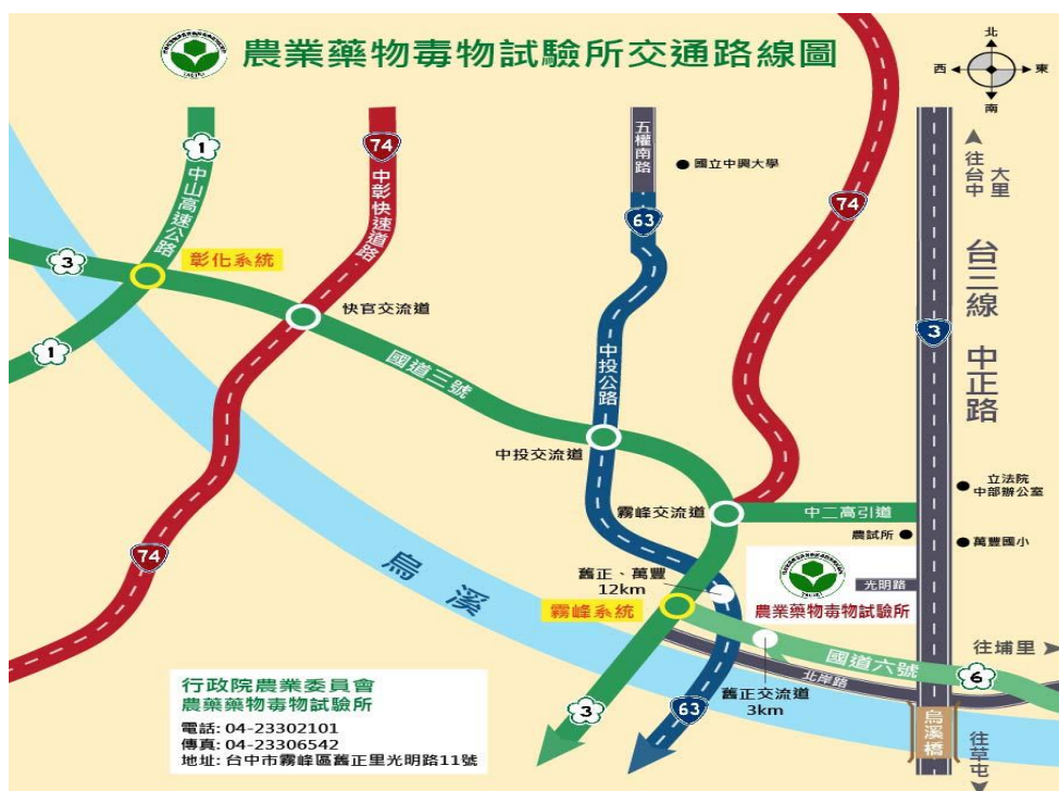
行政院農委會農業藥物毒物試驗所交通位置圖